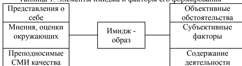
Таблица 1. Элементы имиджа и факторы его формирования

Имидж обязательно должен вызывать симпатию и доверие. В имидже идеализируются наиболее выгодные черты. Но важно помнить, что разрыв между реальной личностью и имиджем политического лидера должен быть минимальным. Имидж политического лидера складывается из различных элементов, которые обязательно нужно учитывать при формировании имиджа 190 :