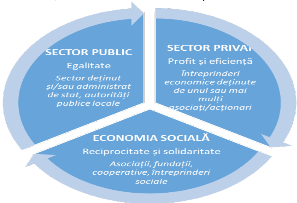
Figura 1. Locul economiei sociale în economia națională [3]

Social enterprises are generally small and medium enterprises (SMEs) contributing to the creation of a sustainable economic model in which the individual is more important than the capital. There is no unique juridical pattern for these enterprises. Many social enterprises are registered as private companies, others are social cooperatives, associations, foundations, volunteer organizations, charity or mutual support organizations. Generally, social enterprises operate in one of the following fields: workforce integration, social services, local development.