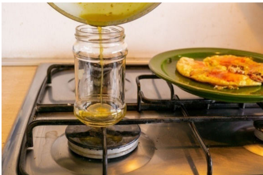
Photo 1: Used cooking oil collection. Foto 1: Colectarea uleiului alimentară uzat.

Romania has the second lowest recycling rate (and the third lowest collection rate) in Europe. One of the most polluting type of waste, gener-