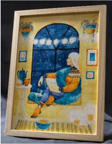
Foto 5: Serenita. Autor: Dan Ungureanu. Photo 5: Serenita. Author: Dan Ungureanu.

mală și devin din asistați social, contribuitori în comunitate. Pornind de la crezul că nu ne putem permite, ca societate, să continuăm fără empatie față de grupurile vulnerabile, îi avem aproape și pe cei de la Asociația Ceva de Spus , care ne educă pe noi toți cu privire la teme importante cum ar fi incluziunea, accesul egal și respectarea drepturilor.