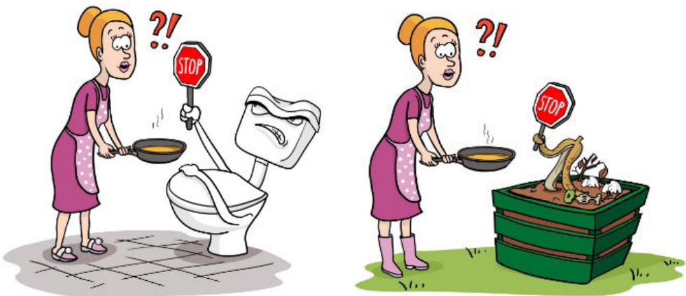
Foto 4: Material educațional. Autor: OilRight Slovenia Photo 4: Educational materials. Author: OilRight Slovenia

product. If I have any conviction, it is that one cannot make sustainable changes in isolation, and that an idea, shared, analyzed and dissected together with professionals from different fields and potential clients, has greater chances of success in implementation. So I kept talking about OilRight ever since I found out about Acceleratorul de Întreprinderi Sociale – a training and funding opportunity for social start-ups that I decided to apply for. And now, the great joy comes from the partnerships that OilRight has developed during all this time. First of all, OilRight Slovenia had from the very beginning a vision of scaling within Central and Eastern Europe, and the idea of replication in Romania came at the right time. Secondly, in Timișoara there was an awareness raising initiative, active for several years now, on the negative environmental impact on the inappropriate discarding of used cooking oil – Borcanul cu Ulei . The experience with home collection systems and their