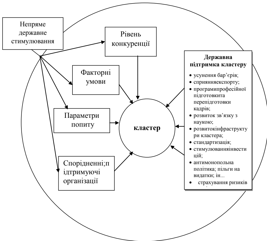
Рис. Модель державно-приватного партнерства в межах кластера

Наказом Міністерства освіти України № 13 від 19.01.94 року для поєднання зусиль навчальних закладів, наукових, проектних організацій і підприємств, для спільного використання матеріально-технічної бази, відповідно до ст. 43 Закону України „Про освіту”, було затверджено типові Положення „Про навчальний та навчально-науково-виробничий комплекс”. Метою створення таких комплексів було упорядкування процесу та підвищення ефективності взаємодії ринку праці та ринку освітніх послуг [2].