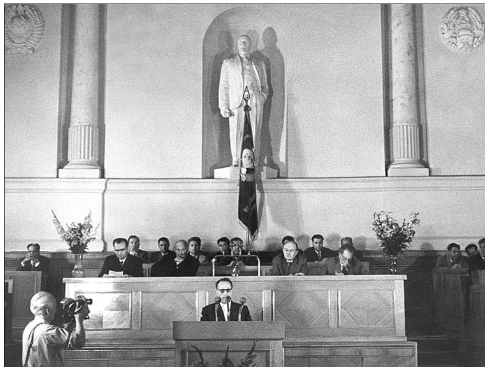
Prima sesiune științifică a AȘ a RSS Moldovenești, 2 august 1961