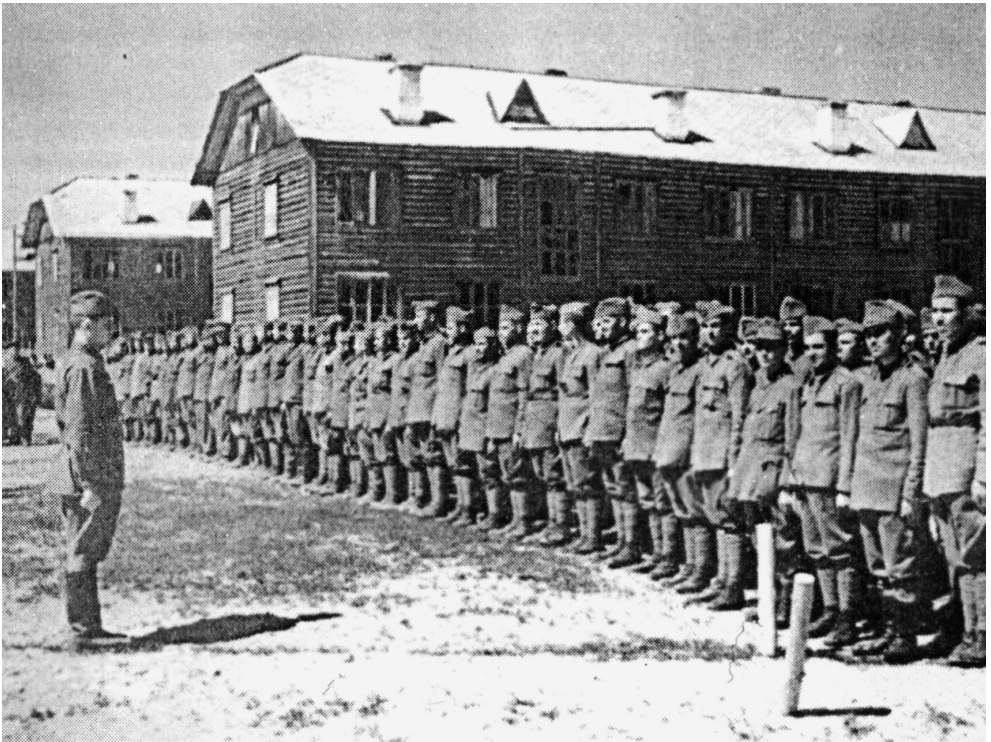
Prizonieri români. 1944

The author reveals historical events and people left behind. He tries to do that for Romanians deported, exiled and taken prisoners on the Soviet territory in order to give the reader an overview of the problem of Soviet GULAG prisoners.