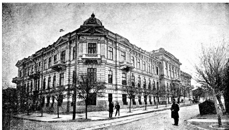
Бессарабское Губернское Правление