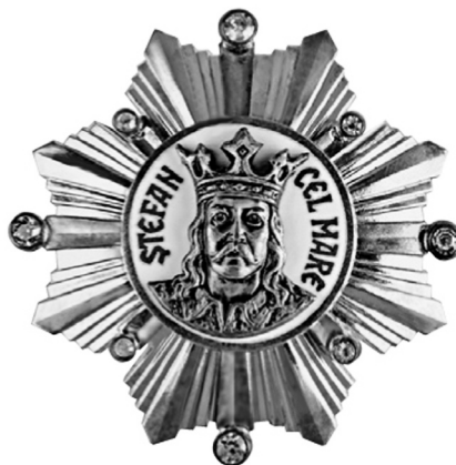
Fig. 2. Ordinul Ștefan cel Mare. Fotografie.