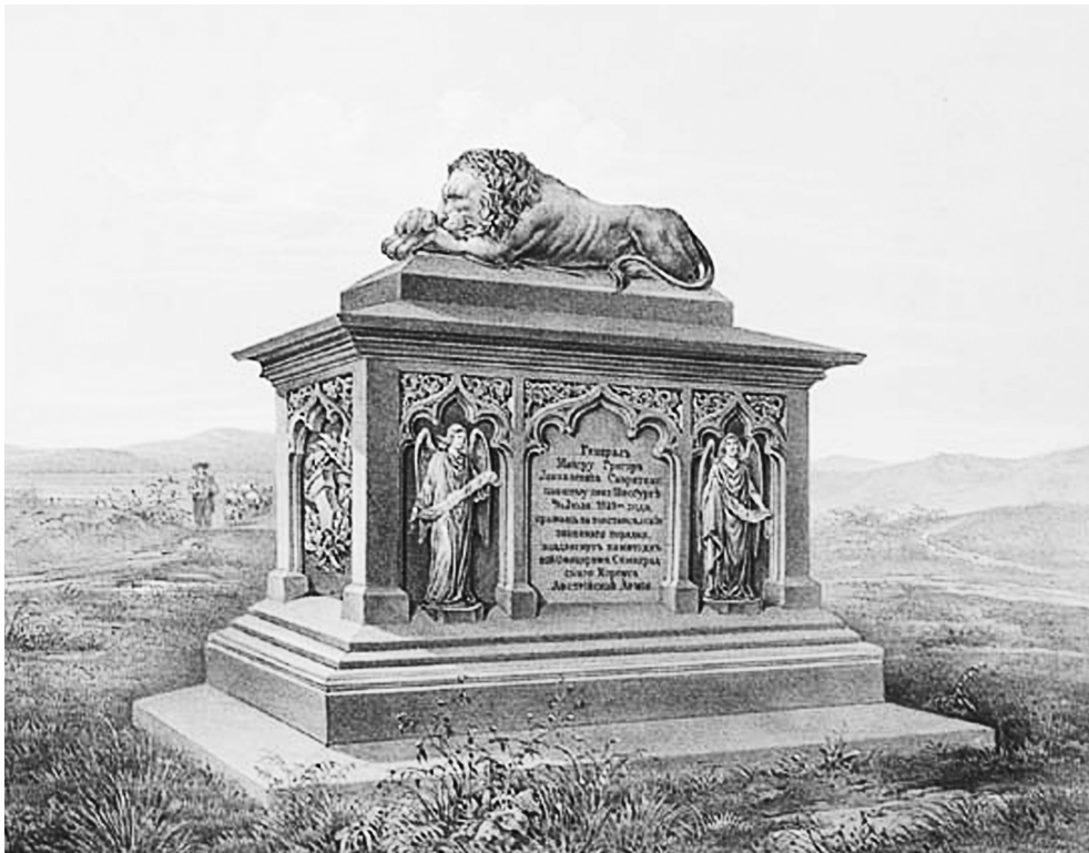
Monumentul lui Grigori Skariatin în a doua jumătate a secolului al XIX-lea. Carte poștală.