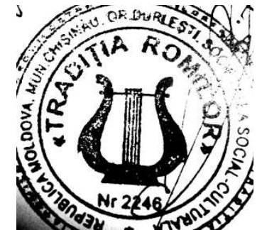
Figura 3. Simbolul Societății Social-Culturale „Tradiția romilor”, or. Durlești, mun. Chișinău.