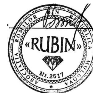
Figura 5. Simbolul Asociației Romilor din Republica Moldova „RUBIN”, mun. Chișinău.