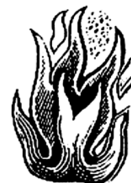
Figura 19. Imaginea este preluată din cartea: LEMON Alaina. - Between two Fires. Gypsy Performance and Romany Memory from Pushkin to Postsocialism. 2000. Durham & London, Duke University Press. - P. 1.