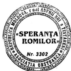
Figura 26. Simbolul Organizației Obștești „Speranța romilor”, satul Țântăreni, raionul Anenii Noi.