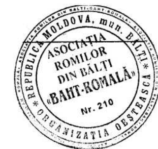
Figura 23. Simbolul Asociației Romilor din Bălți „BAHT-ROMALĂ” (limba romani: „fericirea romilor”).