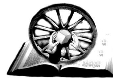
Figura 37. Asociația pentru protecția și educația copiilor și tinerilor romi „ΠΡΟΓΡΕΣ” (limba macedoniană: „Progres”), or. Scopie.