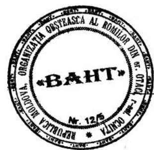
Figura 24. Simbolul Asociației Obștești „BAHT”, (limba romani: „fericire”), or. Otaci, raionul Ocnița.