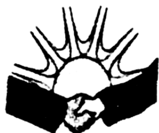
Figura 7. Simbolul Alianței Civice „ROMANI ШУКАРИПА” (limba romani: „Bunătațea romă”), or. Prilep, Macedonia.