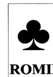
Figura 40. Sigla politică a Asociației cetățenilor români aparținând minorității romilor „Partida Romilor „Pro-Europa”, mun. București, România.