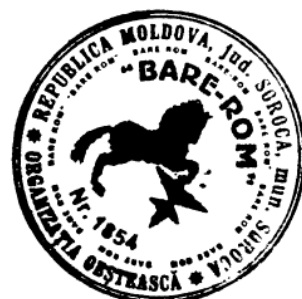
Figura 15. Simbolul Organizației Obștești „BARE-ROM” (limba romani: „Rom valoros”), or. Soroca.