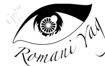
Figura 18. Simbolul Organizației non-profit „ROMANI YAG” (limba romani: „Focul țigănesc”), or. Bruxelles, Belgia.