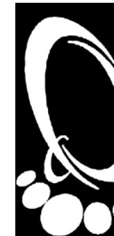
Figura 2. Simbolul Centrului de Resurse pentru Comunitățile de Romi, or. Cluj-Napoca, România.