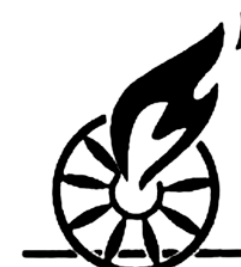
Figura 20. Simbolul Clubului tinerilor „ROMA” (limba romani: „Romi”), or. Plovdiv, Bulgaria.