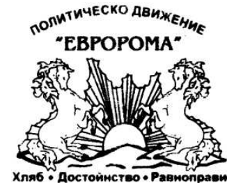
Figura 17. Simbolul Mișcării politice „EBPOPOMA” (limba romani: „Romi europeni”), or. Sofia, Bulgaria.