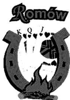
Figura 31. Simbolul Uniunii Romilor Polonezi, or. Szczecinek.