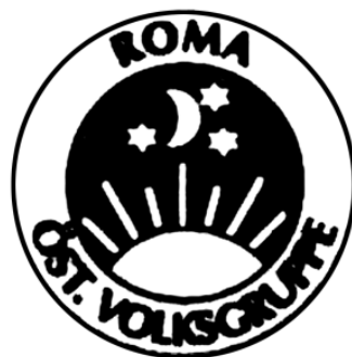
Figura 8. Simbolul Alianței Culturale „Romii din Austria”, or. Viena, Austria.