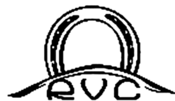
Figura 33. Simbolul Organizației Obștești „Centrul Comunitar al Romilor”, or. Vilnius, Lituania.