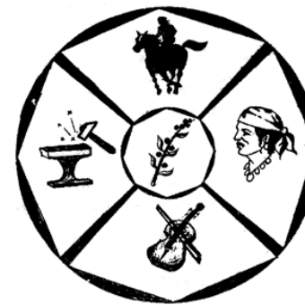
Figura 1. Sigla electorală (Alegeri Parlamentare din România, 27 septembrie 1992) – Uniunea Generală a Rromilor din România, or. Sibiu.