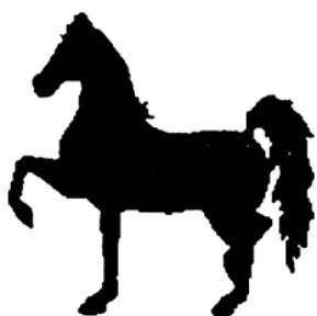
Figura 13. Simbolul Asociației „DŽENO” (limba romani: „Persoană”), or. Praga, Cehia.