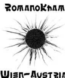
Figura 12. Simbolul Asociației pentru promovarea grupului de etnie romă „Romano Kham” (limba romani: „Soarele țigănesc”), or. Viena, Austria.