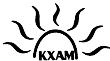
Figura 11. Logotipul Fundației pentru promovarea culturii rome „KHAM” (limba romani: „Soare”), or. Sofia, Bulgaria.