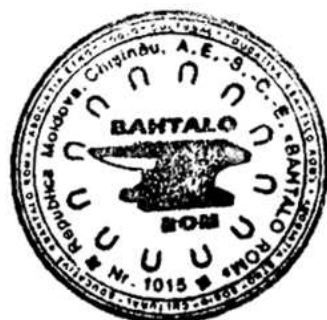
Figura 32. Simbolul Asociației Etno-Socio-Cultural-Educative „Bahatalo rom”, (limba romani: „rom fericit”), mun. Chișinău.