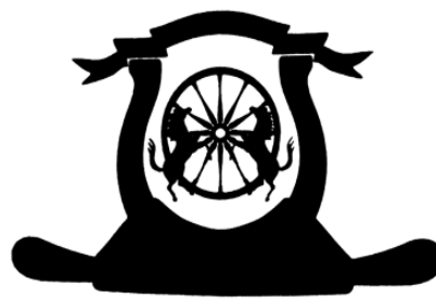
Figura 29. Simbolul Mișcării Social-Politice a Romilor din Republica Moldova, or. Chișinău.