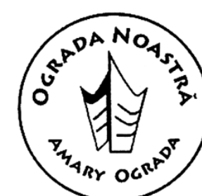
Figura 35. Simbolul Asociației Obștești „Ograda Noastră”, comuna Zărnești, raionul Cahul.