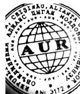
Figura 4. Simbolul Alianței Unite a Romilor „AUR”, mun. Chișinău.