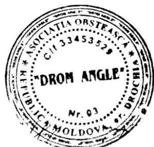
Figura 25. Simbolul Asociației Obștești „DROM ANGLE” (limba romani: „Drumul spre viitor”), satul Chetrosu, raionul Drochia.