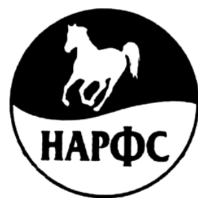
Figura 14. Simbolul Alianței Naționale a Fundațiilor și Asociațiilor Rome „HAPΦC” (*abreviere din limba bulgară), or. Sofia, Bulgaria.