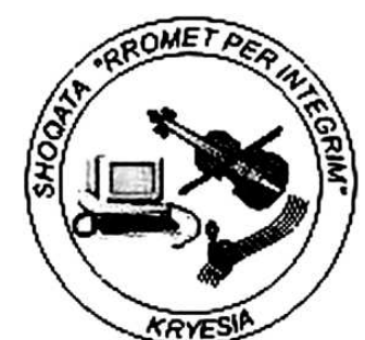
Figura 6. Simbolul Asociației „Romii pentru Integrare”, or. Tirana, Albania.