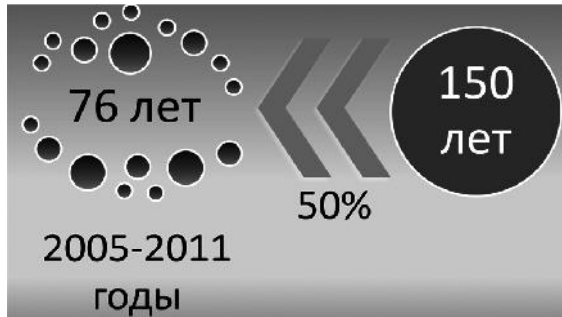
Средняя продолжительность жизни в 2005-2011 гг. относительно юридически установленной

500 . « - 2011 », 13 , , , , . 326 100 , - . 15-20% . 43 , - , 2-3- . : 2008 17,3 . , 2030 - 25 . ; 2010 2,6 2000 , 2015 – 15 ( , 5 ); 15 2000 150 . , 2010 – 300 . , 2 . - « » - 1. , , 1 10 « - , , ». , – 10% - 10% , - 200 1000 . , , 20-25% , – 40-62% - 13-35% .