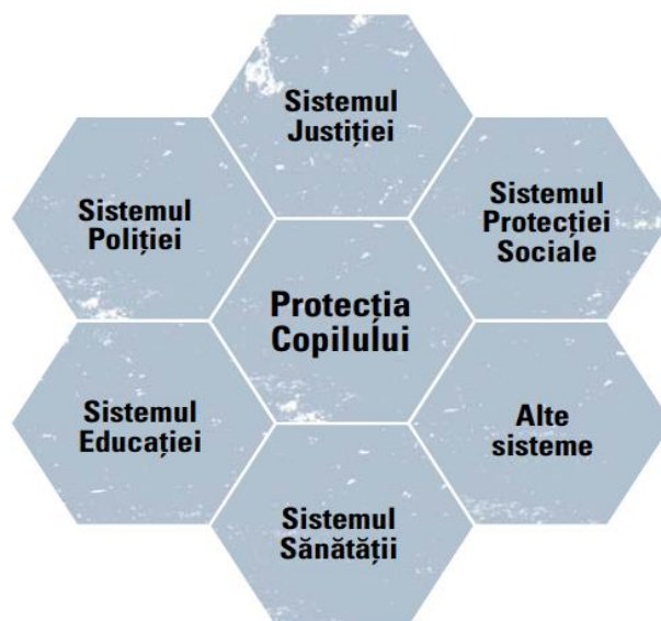
Figura 13.2. Sistemele abilitate pentru protecția copilului

acțiunilor de comportamentului rândul copiilor.