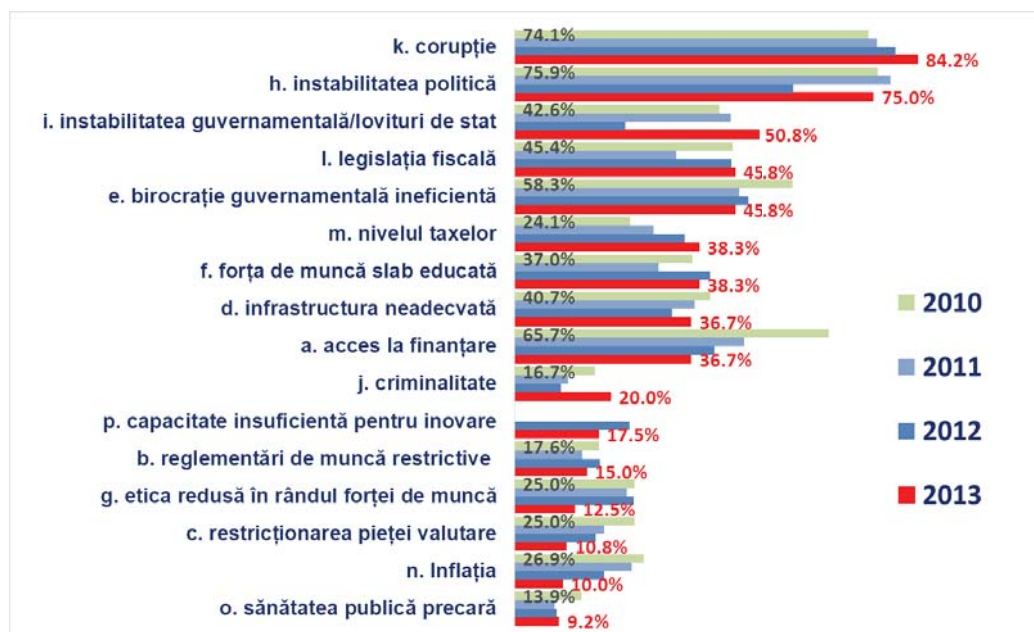
Des. 1. Incidența factorilor cu impact negativ în derularea afacerilor în anii 2010-2013

De remarcat că, potrivit metodologiei WEF, poziția unui stat după Indicele Global al Competitivității este calculată în baza a 110 indicatori, grupați în 12 „piloni” ai competitivității, patru dintre care constituie factori de bază, șase – factori de creștere a eficienței și doi – factori inovaționali. Aceștia sunt: instituțiile, infrastructura, stabilitatea macro-