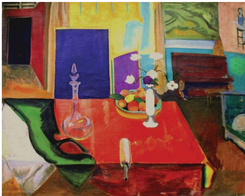
Antoin Irise. Atelierul pictorului II , 1952, u/p, 114×146 cm