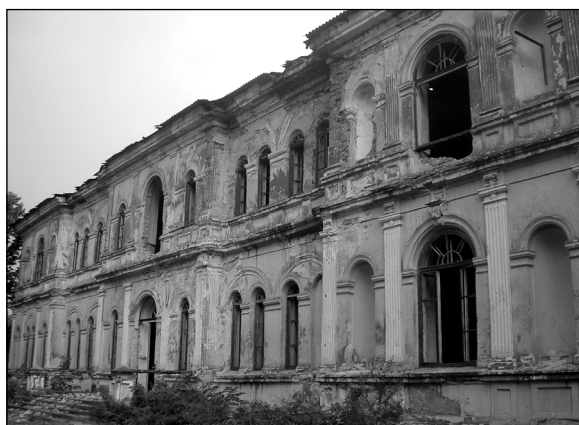
6. Palatul lui Murat din Hâncești (1927, 2010).

ciale al Statului-Major al armatei, sub comanda generalului contele Bekkendorf (Bezviconi 1934, 55) 52 . El a fost căsătorit cu sora contelui Delianov, Elena Delianov. Elena s-a născut la Moscova pe 10 ianuarie 1820 și a murit pe 9/21 ianuarie 1870, la Geneva. În 1845 aveau un fecior de doi ani 53 .