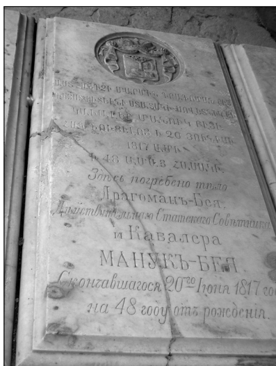
3. Piatra de mormânt a lui Manuc Bey.