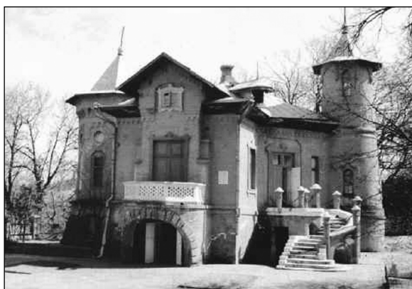
7. „Palatul vânătorului”, construit la comanda lui Murat de către arhitectul Bernardazzi.

ciale al Statului-Major al armatei, sub comanda generalului contele Bekkendorf (Bezviconi 1934, 55) 52 . El a fost căsătorit cu sora contelui Delianov, Elena Delianov. Elena s-a născut la Moscova pe 10 ianuarie 1820 și a murit pe 9/21 ianuarie 1870, la Geneva. În 1845 aveau un fecior de doi ani 53 .