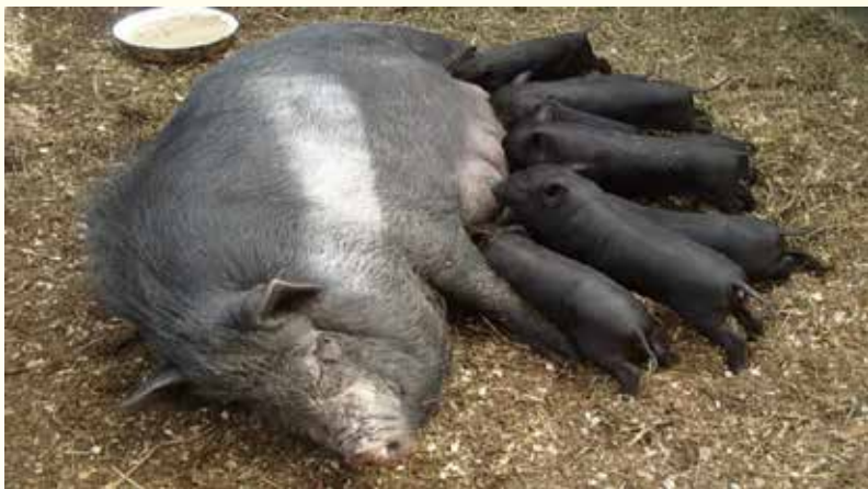
Scroafă cu purcei vietnamezi

(sursa: https://newmagazineroom.ru/ro/strahovye-vznosy/uhod-za-vetnamskimi-svinyami-vetnamskaya-svinya-osobennosti-dannoi/ ; https://porci.webgarden.ro/meniu/vier-vietnamez )