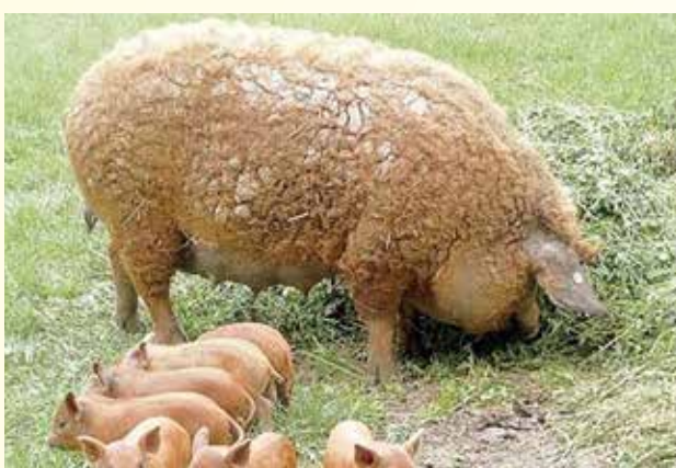
Scroafă cu purcei MANGALIȚA

Porcinele din rasa Mangalița se prestează foarte bine la creșterea extensivă pe pășune, nu sunt pretențioase la hrană, mulțumindu-se cu pășunea și unele fructe de pădure, în același timp reacționează pozitiv la suplimentarea hranei cu concentrate. Animalele valorifică foarte bine aproape toate categoriile de furaje, inclusiv suculentele și porumbul. Preferă întreținerea în adăposturi uscate cu pardoseală moale și poate fi crescută la aer liber cu rezultate bune în sistemul gospodăresc. În timpul verii, se recomandă hrănirea cu ierburi, lucernă și trifoi. Porcii preferă să utilizeze cerealele de la sol și mai puțin din hrănitore.