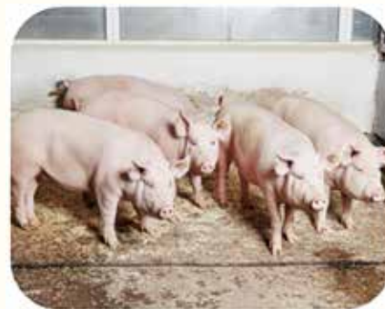
Purceli la îngrijire

Au fost obținute rezultate noi privind dezvoltarea, productivitatea și unele aspecte fiziologice a scroafelor Yorkshire crescute în izolare reproductivă de formă maternă și paternă care sunt prezentate prin următorii indici: prolificitatea în medie la o fătare pe populație – 11,4 cap, pe nucleu – 12,3 cap; greutatea lotului la vârsta de 45 zile pe populație – 112,1 kg, pe nucleu – 125,2 kg; viabilitatea medie pe populație – 94,8 %, pe nucleu – 93,8 %; vârsta la prima fătare – 412 zile, durata perioadei de gestație – 117 zile, durata medie a perioadei între fătări – 184,4 zile. Conform datelor testării la vârsta de 9 luni scroafele de rasa Yorkshire au avut următorii indici: greutatea corporală pe populație – 105,5 kg, pe nucleu – 111,2 kg; lungimea trunchiului pe populație – 127,5 cm, pe nucleu – 131,0 cm; precocitatea pe populație – 260,9 zile, pe nucleu – 240,4 zile; grosimea stratului de slănină pe populație – 15,91 mm, pe nucleu – 15,0 mm.