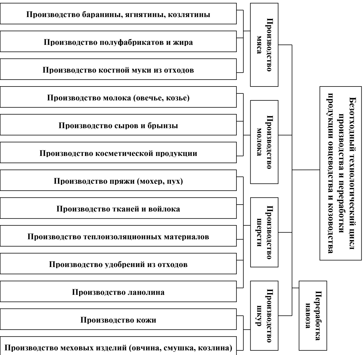
Схема. Безотходный технологический цикл производства и переработки продукции овцеводства и козоводства.