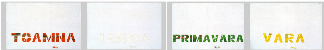
Vladimir Us. Cele 4 anotimpuri. Peisaj, 2000 . Poliptic. Ulei pe pânză 60 × 100 cm fiecare

cunosc o adevărată expansiune, fenomen care face ca oferta culturală să devină mult mai importantă decât capacitatea de absorbție din partea publicului. Această asimetrie pune în pericol evoluția proceselor culturale. Or, până la urmă viabilitatea culturii rezidă în consumul ei: dacă nu este consumată, atunci înseamnă că este produsă în surplus, ceea ce pe de o parte stagnează dezvoltarea culturii, pe de altă parte provoacă ruptura dintre lumea artelor și societatea civică.