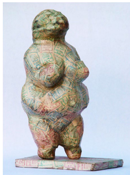
Ghenadie Popescu. Taxatoarea , 2003, papier-mâché, colaj, 39 × 24 × 16 cm

Pentru această, vom medita mai întâi asupra noțiunii de mediere culturală, exploatarea câteva definiții și evocând rolul unor asemenea acțiuni în