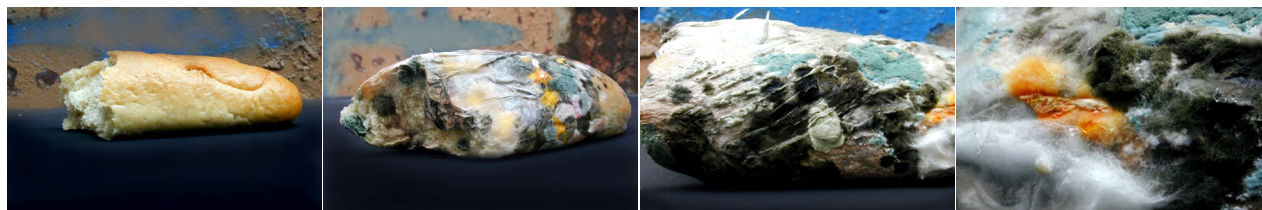
Irina Frankova. Transformare, 2004 . Serie fotografică: o franzelă, observată timp de o lună, până la stadiul de mucezure completă

Ce ne spun aceste elemente istorice? Și despre faptul că peste 60 de ani de regim totalitar au lăsat cu siguranță urme adânci în artă și în societate (care nu sunt gata să dispară nici până azi). Dacă e să dăm o caracteristică succintă a situației create în Republi-