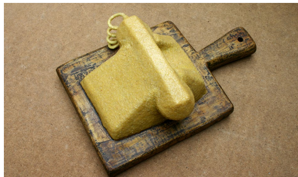
Ghenadie Popescu. Obiecte MM , fragment, 2008 – 2011, făină de porumb, clei aracet, obiecte

(invitând cititorul la discuții), fie de note, dialog sau interviu (proponând informații pertinente), fie de exemple concrete (cu referire la dificultăți susceptibile de a fi întâlnite de un public mai vast), și includ „două categorii de termeni implicați în artele vizuale ale timpului nostru: