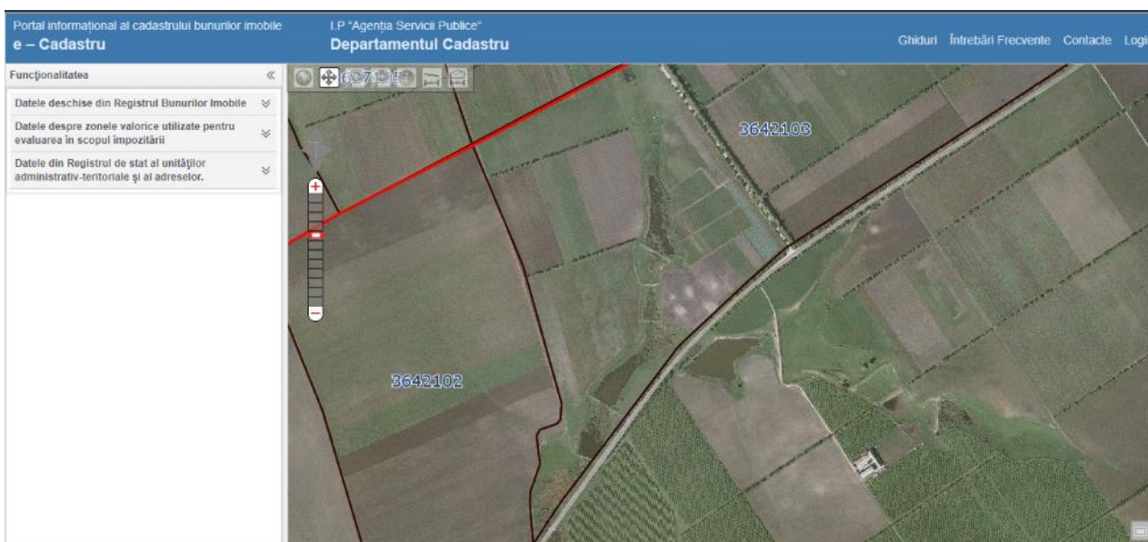
Figura 3. Bazine acvatice de pe teritoriului satului Zgurița raionul Drochia, până la procesul de Delimitare