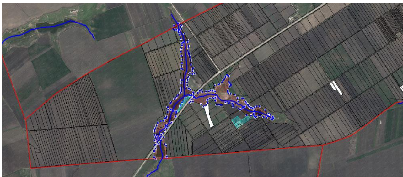
Figura 4. Bazine acvatice din satul Zgurița raionul Drochia, după procesul de delimitare cadastrală a terenurilor proprietate publică