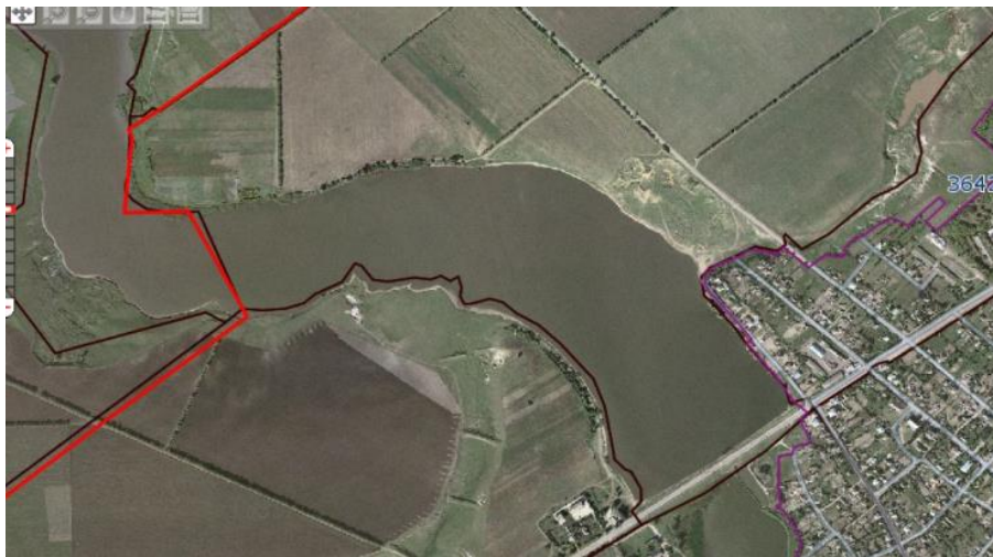
Figura 1. Bazin acvatic din satul Zgurița, raionul Drochia, formă inițială

În procesul de delimitare cadastrală a proprietății publice, în acest sat s-a folosit metoda delimitării după ctegoria de destinație și în dependență de apartenență a terenului. Astfel în Figura nr. 1 este reprezentată forma inițială a bazinului acvatic care este reprezentată pe "Portal Informațional al cadastrului bunurilor imobile " fiind proprietate a statului și imaginea din Figura 2 cea creată de autor în procesul de delimitare cadastrală a lacului ce aparține fondului apelor care se marchează cu culoarea galbenă.