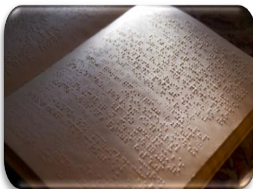
Fig. 4. Sistemul Braille

La elevii cu deficiențe auditive prima etapă în constituirea cuvântului este percepția lui vizuală. Totodată, la elevi se formează primele închipuiri despre funcția de semnalizare a cuvântului. Prin intermediul receptorilor auditivi se formează percepția audio-verbală a comunicării.