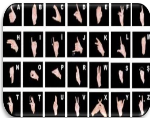
Fig. 3. Alfabeta limbii române în dactileme

Calitatea intervențiilor educative este condiția fundamentală a integrării sociale pentru elevii cu deficiență de auz, dezvoltarea și perfecționarea funcțională a analizatorilor funcționali, antrenarea organelor fonatorii prin exerciții speciale, demutizarea sprijinită de Sistemul Braille și de Sistemul Dactil, cunoașterea nemijlocită a obiectelor din jur, orientarea în spații mici, formarea deprinderilor de autodeservire, valorificarea noilor echipamente și a tehnologiilor moderne destinate acestor categorii de persoane sunt doar câteva priorități în fundamentarea programelor individualizate de intervenție și recuperare [6, p. 5].