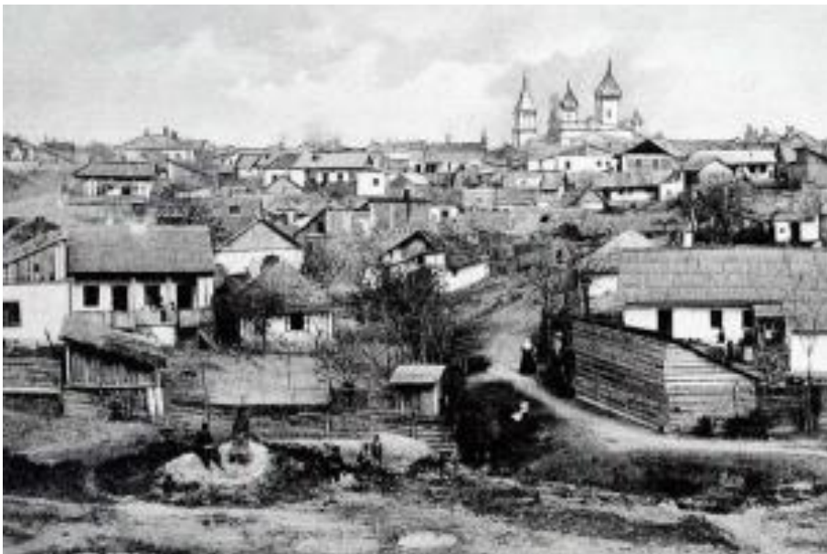
Фото 1. Кишинев начала XX в. http://oldchisinau.com/kladbishha-cerkvi-sinagogi/starye-cerkvi-kishinova/sokhranivshiesya-cerkvi/chuflinskaya-cerkov-cerkov-sv-feodor/chuflinskaya-cerkov-fotografii/