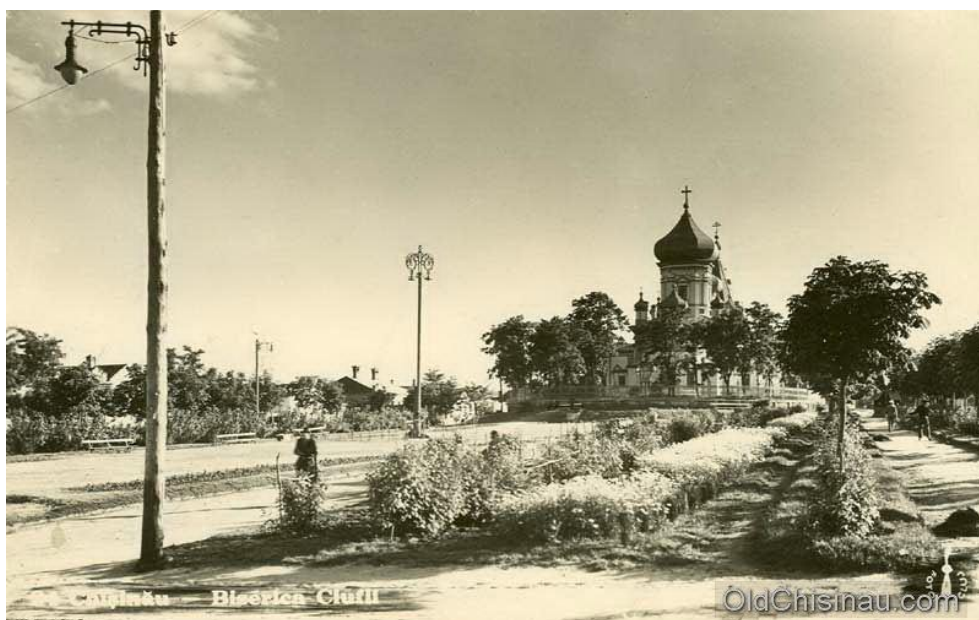
Фото 3. Чуфлинская церковь в начале XX в. Ibidem.