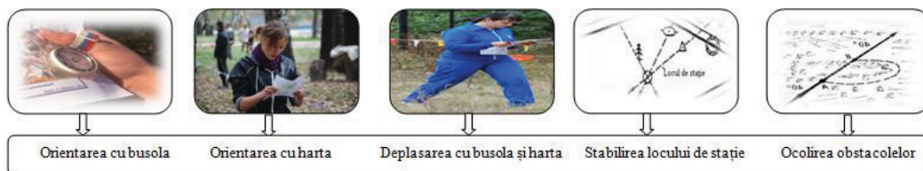
Foto 1. Elemente de orientare sportivă asimilate de studenți la lecția de educație fizică

sprijin pe repere vizibile (obiecte de pe teritoriul Universității), a tehnicii triunghiulare și dreptunghiulare.