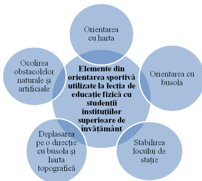
Fig. 1. Elemente din orientarea sportivă utilizate la lecția de educație fizică cu studenții instituțiilor de învățământ superior

O bună parte a activităților realizate la lecția de educație fizică cu studenții au presupus utilizarea busolei pentru orientarea sportivă. La lecțiile de educație fizică cadrele didactice, în primul rând au familiarizat studenții cu tipurile de busole și cu aspectul caracteristic al acestora. Totodată, au explicat cum aceasta poate fi aplicată și care este modalitatea de lucru în teren, oferind studenților oportunitatea de a se orienta după busolă.