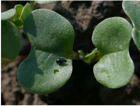
Puricele negru ( Phyllotreta atra )