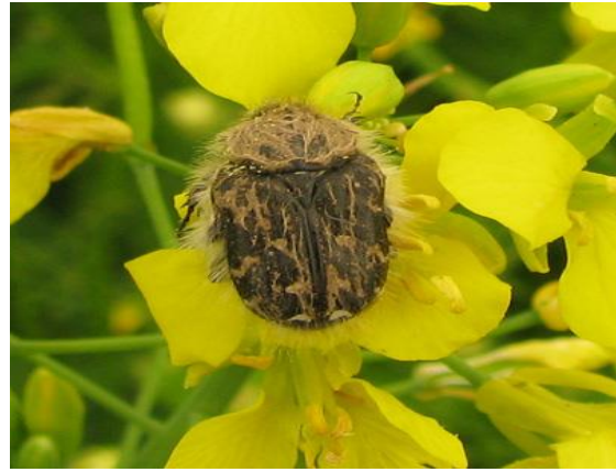
Gândacul păros ( Epicometis hirta )