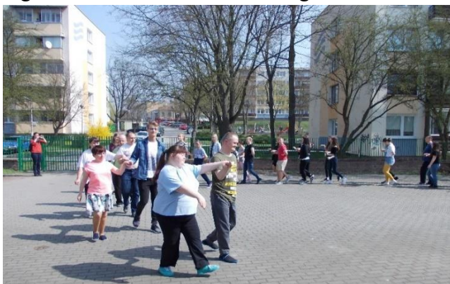
Figura 6. Lecție de dans alături de copii cu sindrom Down, în Polonia, în cadrul proiectului School 21, Digitally and Socially Your

Un alt proiect Erasmus+ și eTwinning, School 21 – Digitally and Socially Yours, s-a axat pe servicii în folosul comunității în diferite sfere de voluntariat: refugiați, persoane cu dizabilități fizice sau mentale, adăposturi pentru animale, persoane cu risc de excludere. Obiectivul principal a fost dezvoltarea celor patru super-competențe: gândirea critică, colaborarea, comunicarea și creativitatea prin implicare activă în acțiuni de voluntariat, dublată de facilitarea formării competențelor digitale prin activități practice desfășurate într-un cadru internațional. Nu în ultimul rând, comunicarea cu partenerii de proiect – orală, scrisă sau digitală – s-a realizat în limba engleză.