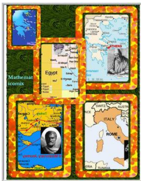
Figura 2. Coperta broșurii Mathematicomix