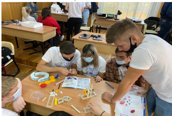
Figura 7. Echipă internațională de elevi construind un dispozitiv care să pună în evidență energia eoliană, în cadrul proiectului TESLA

echipă, cele de soluționare a problemelor ivite pe parcursul documentării și al prezentării rezultatelor activității.