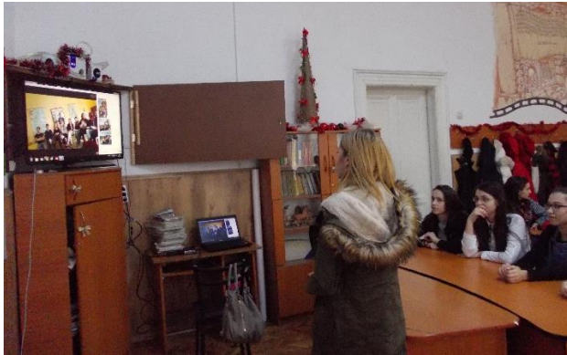
Figura 5. Lecție pe Skype cu partenerii din Republica Cehă, despre tradiții de iarnă, în cadrul proiectului ESCAPE

viața reală le vor fi extrem de utile atât în călătoriile lor viitoare dar și în eventualitatea dezvoltării unei cariere în unul dintre statele europene.