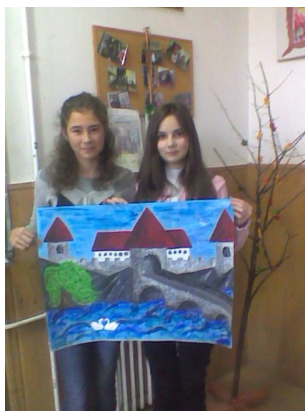
Figura 3. Castelul desenat de două eleve, în cadrul proiectului King of My Castle

Cele două proiecte descrise mai sus au fost implementate la clasele de gimnaziu. Proiectul Cyphers and Codes, în schimb, a fost destinat elevilor de liceu, care au descoperit istoria spionajului prin schimbul de mesaje codate cu partenerii lor europeni. Ei au folosit pentru cifrarea și descifrarea mesajelor algoritmi și alte instrumente matematice ca analiza frecvențelor, dar și sisteme de numerație binare, zecimale și hexazecimale. Mesajele transmise pentru a fi decodate de parteneri conțineau informații culturale, tehnice, istorice sau geografice referitoare la locațiile școlilor participante, dar și la elevii implicați în proiect.