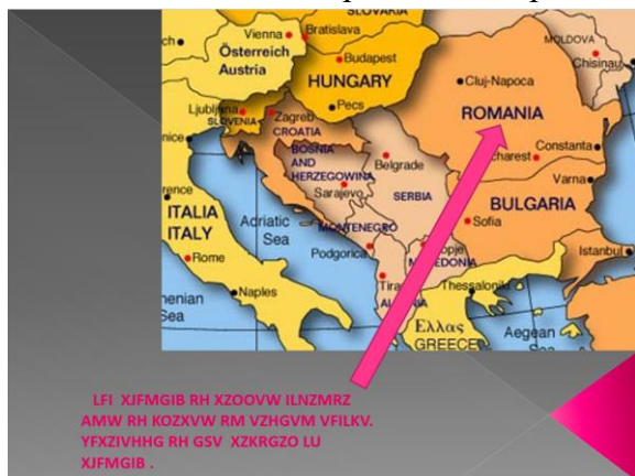
Figura 4. Mesaj cifrat despre țara noastră, utilizând codul de substituie Cesar, în cadrul proiectului Cyphers and Codes

tipuri de coduri utilizate de-a lungul istoriei, iar descoperirea faptului că matematica oferă instrumente pentru cifrarea și descifrarea acestora i-a intrigat. Interdisciplinaritatea a decurs din utilizarea limbii engleze sau franceze pentru a comunica direct cu partenerii, din studiul împrejurărilor istorice în care s-au folosit codurile folosite, căutarea online a instrumentelor de codificare a mesajelor și aplicarea algoritmilor întâlniți în programare. Pe parcursul derulării proiectului, elevii au folosit site-uri specializate precum http://cryptoclub.math.uic.edu , http://quickcrypto.com/free-steganography-software.html , http://www.secretcodebreaker.com , și au venit în contact pentru prima dată cu prezentările Prezi, jocurile teach.it sau HotPotatoes. Ei au folosit Movie Maker pentru a crea prezentări video.