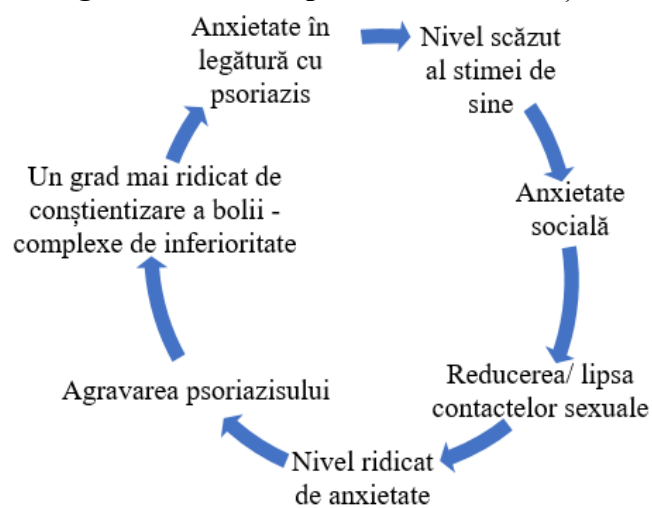
Fig. 1. Modelul biopsihosocial de menținere a psoriazisului (Papadopoulos și Bor, 1999).

Modelul biopsihosocial de menținere a psoriazisului reliefează structura factorilor psihologici asociați psoriazisului pe baza cărora este interpretată realitatea înconjurătoare de către pacient, ceea ce conduce la consecințe, comportamente dezadaptative cu impact la nivel personal, familial, social și profesional. Acest model arată faptul că psoriazisul este rezultatul unui efect combinat și dinamic dintre procesele fiziologice (dezechilibrele endocrinologice), stările psihice (anxietate, nivel scăzut al stimei de sine) și situațiile sociale care provoacă anumite stări și cogniții disfuncționale (sentimente de rușine din cauza leziunilor, credința că nu poate fi la fel de atractiv pentru a putea fi atins, respectiv reducerea contactelor sexuale ș.a.) [16].