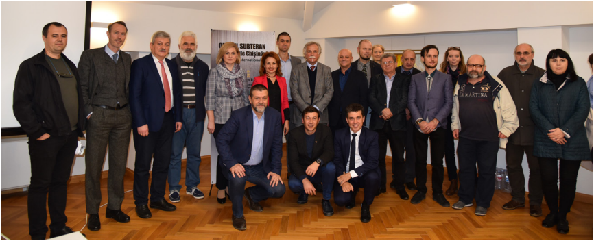
Participanți la Conferința internațională „Identitățile Chișinăului”, ediția a VI-a, anul 2019

provenită din țară, realizând o sinteză de neașteptat între ruralismul moral și urbanismul intelectual” (Mihai Cimpoi).