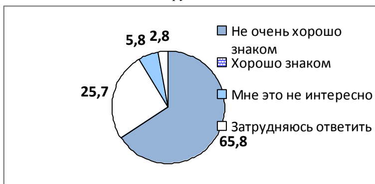
Рисунок 1. Мнение респондентов насколько хорошо они знакомы с национальной белорусской культурой, %

В ходе анкетирования более половины (65,8%) отметили невысокий уровень знакомства с культурой народа Беларуси (рисунок 1). Это при том, что 89,8% опрошенных отнесли себя к представителям белорусской национальности. Вариант ответа «Хорошо знаком» выбрал каждый четвертый респондент (25,7%). Чаше других такую уверенность демонстрировала молодежь (38,4%) и респонденты пенсионного возраста – старше 60 лет (37,8%). Отметим и то, что понятие хорошо знаком, можно поставить под сомнение, сложилось предположение, что основная масса населения области, вообще не очень хорошо знакома с культурой белорусов. Это косвенно подтверждается исходя из анализа ответов на остальные вопросы анкеты: малая распространенность белорусского языка среди населения и нежелание его возродить; низкий интерес к белорусской литературе; пассивная гражданская позиция по возрождению культуры и незаинтересованность в знакомстве с ней в рамках семейного воспитания и другое.