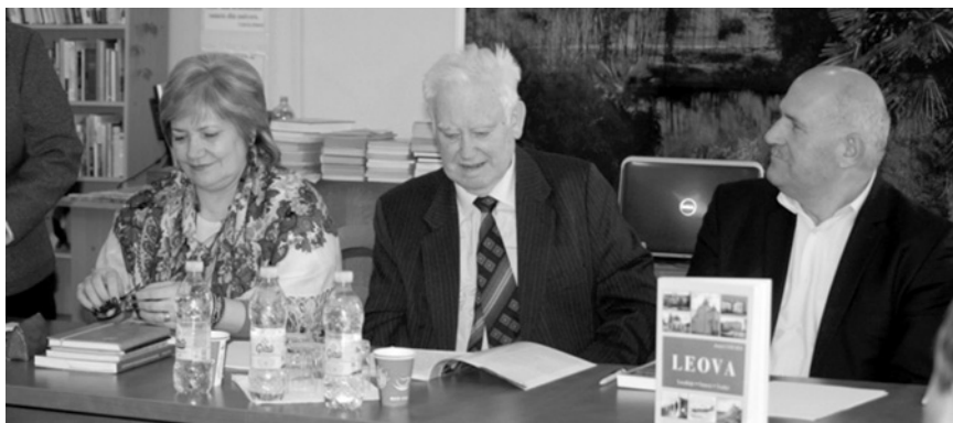
Lansarea monografiei „Leova: localități, oameni, tradiții” (or. Leova, 2018)

1990 (200 p.); Moldavskaia onomastika. Obzorni očerki issledovanii , Chișinău, 1984 (144 p., în colaborare).