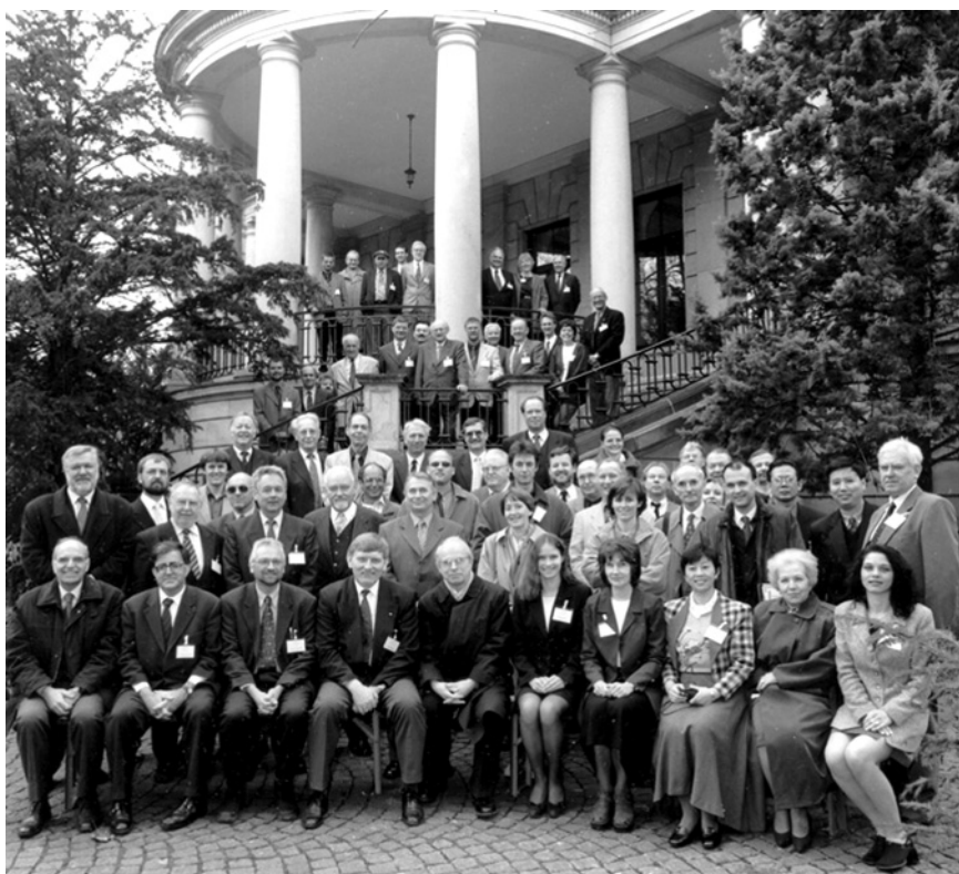
Participanții la Conferința Internațională „Standardizarea denumirilor geografice” (Sub egida ONU, Frankfurt pe Main, 1998)