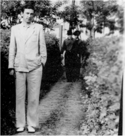
Ani de studenție (1954)