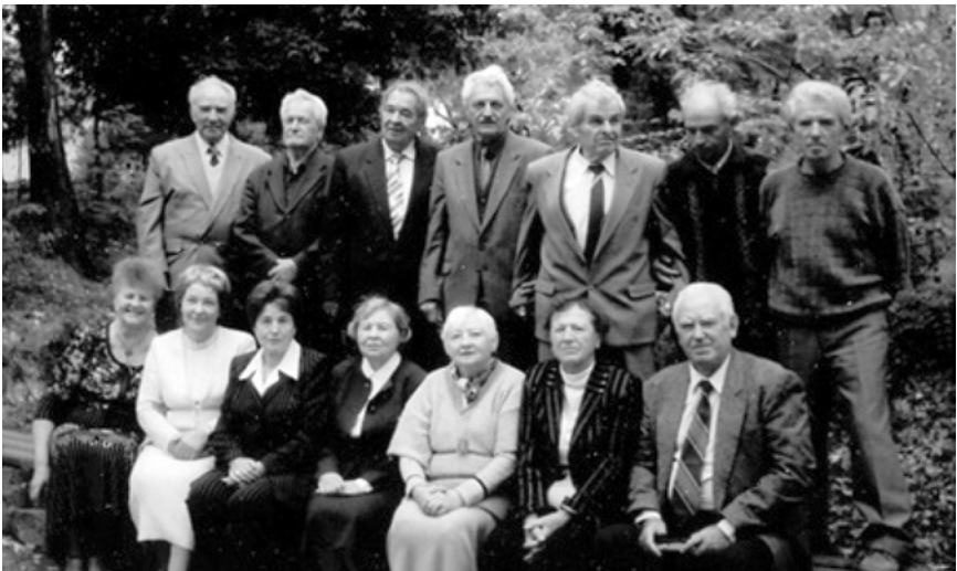
Promoția de filologi universitari 1952. Colegii de grupă (2017)

Sunt de menționat lucrările cu caracter de popularizare a științei onomastice: Graiul Pământului. Schițe de toponimie românească , Chișinău, 1981 (128 p.); Tainele numelor geografice , Chișinău, 1986 (100 p.); Gheografičeskie nazvania rasskazyvaiut , Chișinău, ed. 1, 1982, ed. 2,