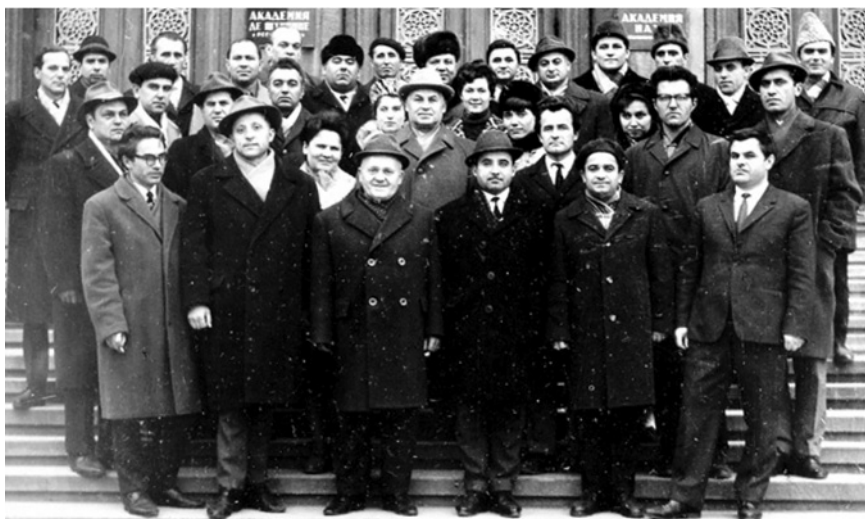
Institutul de Limbă și Literatură (1982)