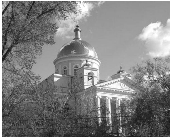
Fig. 3. Catedrala „Schimbarea la Față a Domnului” din orașul Bolgrad (2011)