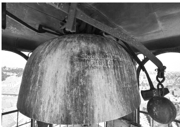
Foto 2. Clopotul orar din turnul Casei Sfatului din Braşov.