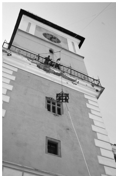
Foto 10. Ridicarea mecanismului în turn.