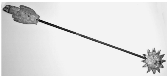
Foto 1. Arătător de orologiu din Colecția Muzeului Județean de Istorie Brașov.