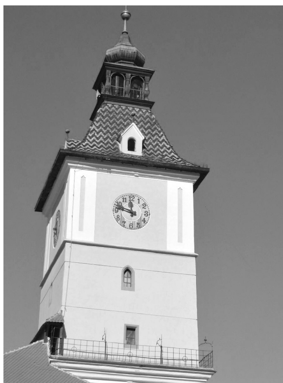
Foto 6. Forma actuală a turnului Casei Sfatului.