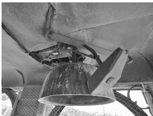
Foto 7. Clopotul pentru bătaia sferturilor de oră.

Secolul al XIX-lea a reprezentat în istoria orologeriei așa-numita „vârstă industrială”, perioada în care atelierele ceasornicarilor și-au dezvoltat și perfecționat meșteșugul, făcând pasul către producția de serie. Totodată ceasornicarii, datorită experienței în domeniu, au avut o contribuție deosebită în dezvoltarea aparatelor de precizie. În aceste împrejurări, pe harta industrială europeană, și-au făcut apariția primele fabrici de orologii,