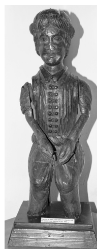
Foto 4. Figurina care acţiona mecanismul de orologiu.