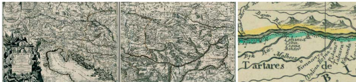
Рис. 5. Карта «Течение Дуная...» [Coronelli et al. 1688] (а) и её фрагмент (б).

Наиболее точная по сравнению с предшественниками карта «Течение Дуная...» ( «Le Cours du Danube...» ) была создана в 1688 г. специально для военного министра величайшего французского короля Людовика XIV маркиза Куртанво (Франсуа-Мишель Летелье, маркиз Лувуа) выдающимся картографом В.-М. Коронелли (V.-M. Coronelli, 1650–1718) и его коллегами Ж.-Н. Дю-Тралажем (Тиллемоном) и Ж.-Б. Ноленом [Coronelli et al. 1688] (рис. 5а). Бендеры на этой карте впервые подписаны сразу четырьмя вариантами топонима: Tehinia Tekin Tegin Bender (рис. 5 б).