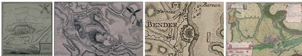
Рис. 8. «Видъ и начертаніе осады города Бендеръ...» [Видъ 1770] (а), «Бендеры Bender» [Бендеры 1770] (б), фрагмент «Карты Молдавии...» [Bawg 1771] (в), «План Бендерской крепости...» [План 2020].

Новая эпоха в картографии Северо-Западного Причерноморья наступает в период русско-турецкой войны 1768–1774 гг. в результате активной деятельности военных топографов екатерининского времени [Хропов 2019, Герцен 2020в]. В первую очередь это относится к самим Бендерам, успешная двухмесячная осада которых с 15 июля по 16 сентября 1770 г. стала одним из главных событий войны, что нашло широкое отражение в русской и западноевропейской картографии. Яркими примерами таких произведений выступают планы и карты разных масштабов: «Видъ и начертаніе осады города Бендеръ взятого приступомъ Импер. Россійск. Войскомъ. Сент. 16. дня 1770 года» [Видъ 1770] (рис. 8а); «Бендеры Bender» [Бендеры 1770] (рис. 8б); «Карта Молдавии для служения Истории милитерной войны между Русскими и Турками» (« Carte de la Moldavie... ») Ф.В. Бауэра (F.W. Bawg; 1731–1783) [Bawg 1771] (рис. 8в). Многочисленные изображения Бендер, в том числе редчайшие архивные и ранее не введённые в научный оборот, содержатся в новейших изданиях, посвящённых истории города и крепости [Бендерская 2019; «И славой...» 2020], например, «План Бендерской крепости с показанием, в каком она состоянии по взятии Второй российской армией от турок находится, то есть от 16 сентября 1770 года» [План 2020] (рис. 8г).