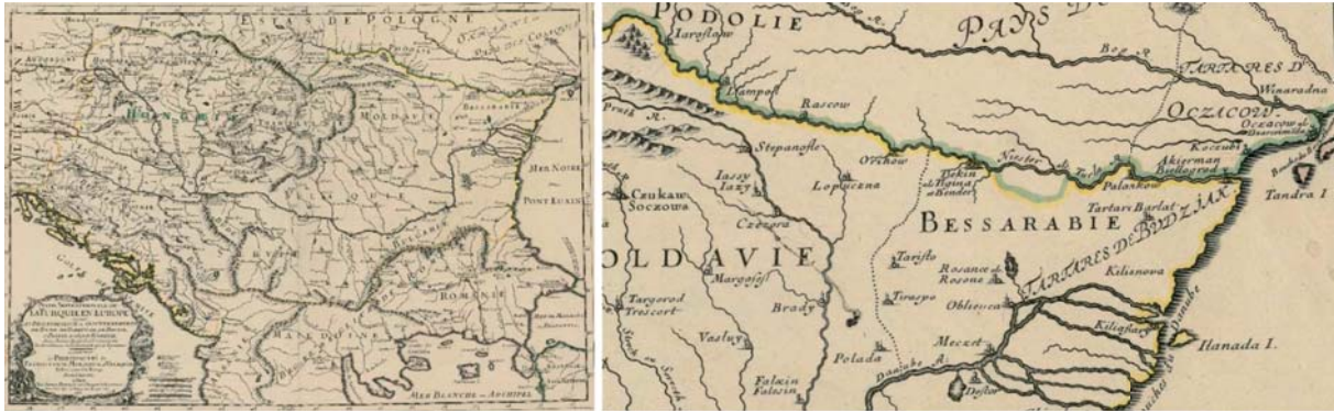
Рис. 3. Карта «Северной части Турции в Европе...» [Sanson 1670] (а) и её фрагмент (б).

«Новая карта Черного моря и Константинопольского канала очень точная» («Nouvelle Carte de la Mer Noire et du Canal de Constantinople tres exacte») создана (согласно легенде на последующих публикациях – «обнаружена», «выявлена») Николаем Висшером Младшим (Nicolaes Visscher II; 1649–1702) в 1680-е гг., после смерти которого его жена Елизавета продала семейную коллекцию другим голландским картографам. Так карта была вновь опубликована в первой половине XVIII в. Питером Шенком Младшим (Peter II. Schenk, Peter Schenk der Jüngere; 1693–1775) (рис. 4 в, г) и Генрихом де Летом (Hendrik de Leth, Henry de Leth; 1703–1766) (рис. 4 а, б). Дата публикаций (1733 г.) условна, приводится по указанному П. Шенком году в легенде врезки.