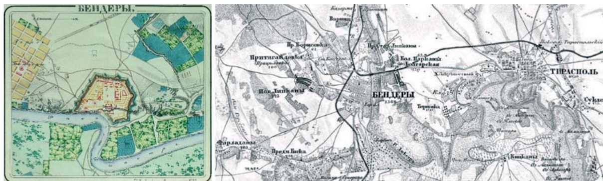
Рис. 9. Бендеры на плане первой трети XIX в. [Бендеры 1830] (а) и Военно-топографической карте Западной России (вторая половина XIX в.) [Старковъ и др. 1877] (б).

должение выполнения крепостью своих первоначальных функций (рис. 9а) [Бендеры 1830]. Во второй половине XIX в. картографическая наука и искусство в целом достигли вершин развития в рамках допромышленного периода (следующий качественный переход произойдёт вследствие развития космических и информационных технологий), а к концу века в пространственном отношении в целом оформились контуры современных мест и форм расселения, что наглядно демонстрирует географическое положение Бендерско-Тираспольской агломерации (рис. 9б) [Старковъ и др. 1877].