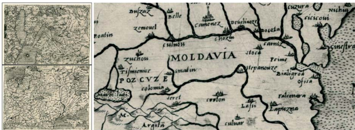
Рис. 1. Карта Дж. Гастальди [Castaldi 1562] (а) и её фрагмент (б).

Первое географическое изображение Тигины встречается, видимо, на двулистной карте 1562 г. пьемонтского картографа Джакомо Гастальди (Giacomo di Castaldi, Giacomo Gastaldo, Jacobo Castaldo; 1500–1566) «Изображение современной географии Королевства Польского...» ( Il Disegno de Geografia Moderna Del Regno di Polonia... ) [Castaldi 1562] (рис. 1а). Город подписан как Teime (первую букву также можно прочесть как F ; скорее всего правильно читать – Teinie ), отмечен в форме замка (как и другие, обозначенные на карте) на правом берегу Днестра в составе Молдавии (Moldavia) (рис. 1б).