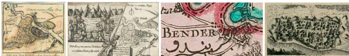
Рис. 7. Карты О. де ла Моттрэ [Mottraye 1711] (а), [Plan 1713] (б), Д.А.Б. Рицци-Дзаннони [Rizzi Zannoni 1772] (в), А. Затта [Zatta 1795] (г).

Совершенно отдельно в этом свете стоят четыре независимых источника, содержащих уникальные изображения Бендер. Опубликованная одновременно с произведениями Вольфа карта «План Крепости Бендерн...» (« Plan von der Festung Bendern... »), авторство которой по сведениям Библиотеки Румынской академии принадлежит О. де ла Моттре (A. de la Mottraye; 1674–1743) [Mottraye 1711] (рис. 7а), разительно отличается от своих предшественников и современников. Неразрывно связан с ним другой одноимённый, но не идентичный рисунок, изданный без упоминания авторства, предположительно в 1713 г. [Plan 1713] (рис. 7б). Совокупность сближающих черт и различий между ними говорит о том, что оба восходят к одному прототипу.