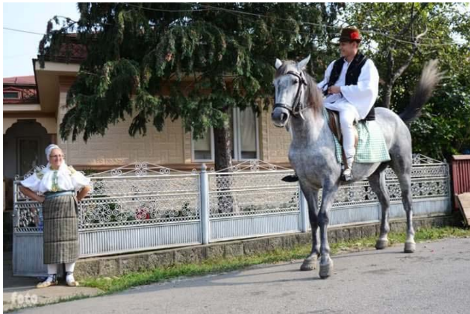
Fig. 2.3. Călăraș, invitând la nuntă.