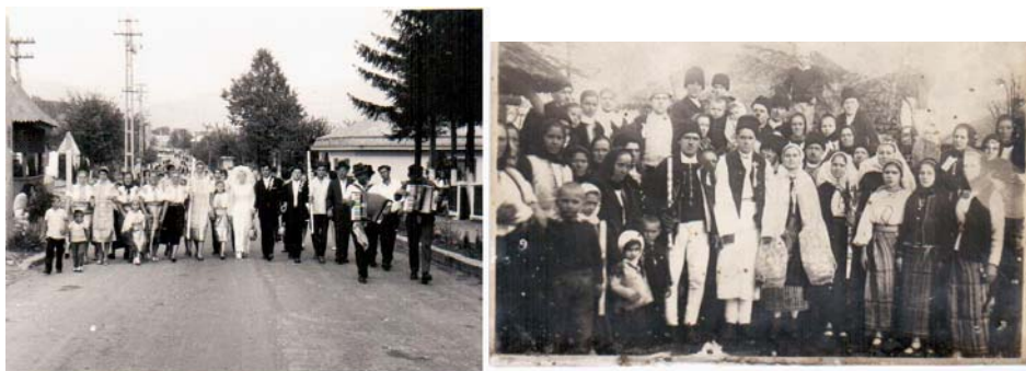
Fig. 2.4. Alaiuri de nuntă

„Colocoșenia” se încheie cu invitația către socru să închine din: „Acea butușină uscată/ lată și la mijloc crăcănată” (plosca de vin) și cu urarea „Noroc și bine v-am găsit sănătoși”.