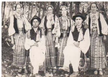
Fig. 2.8. Secvențe sovejene.