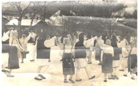
Fig. 2.9. Suita de dansuri populare sovejenești, la nuntă „De dorul”.