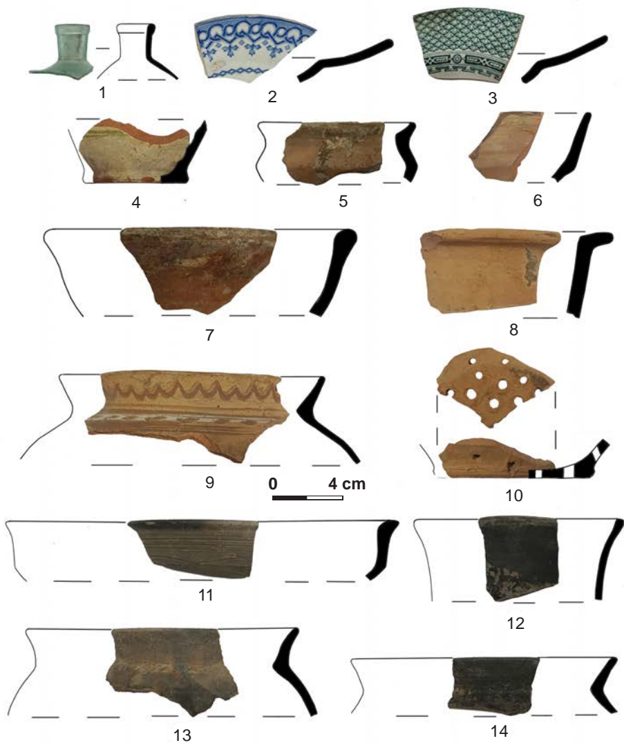
Fig. 4. Bălți 2023. Fragmente de vas de sticlă (1), porțelan (2-3) și ceramică (4-14).