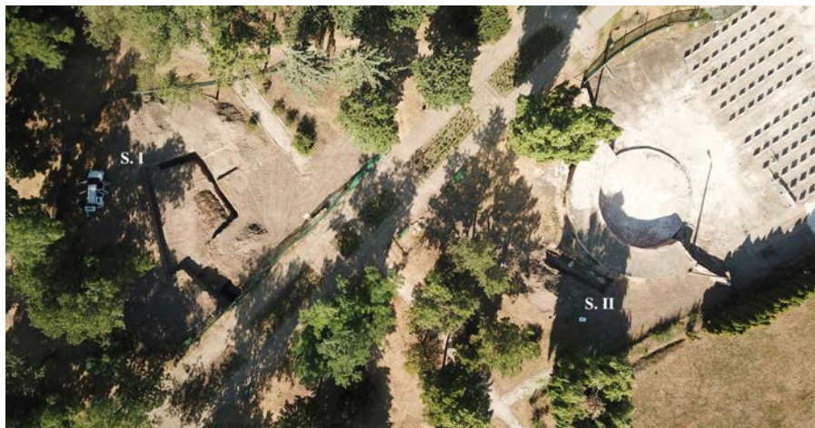
Fig. 1. Bălți 2023. Imagine aeriană asupra zonei cercetate.

Din solul excavat anterior de muncitori și din cadrul sondajelor arheologice au fost recuperate o monedă de bronz românească de tip Mărțișor emisă în anul 1906 ( Fig. 2, 2 ), 5 monede sovietice din anii 40 ai sec. XX, care alcătuiau un mic depozit monetar ( Fig. 2, 3 ), diferite piese de metal ( Fig. 2, 4-6 ) și mai multe fragmente de vase ceramice, faianță și sticlă de la sfârșitul sec. XIX și sec. XX ( Fig. 3 ). Dintre numeroasele piese ceramice, asupra cărora nu putem insista aici, evidențiem un castron fragmentar de mari dimensiuni de formă aproximativ tronconică, lucrat la roată din pastă fină cărămizie și acoperit în interior cu smalt verde ( Fig. 1, 1, 3 ) și un fragment din partea inferioară a unei strecurători lucrate la roată din pastă nisipoasă și arsă oxidant la cărămiziu ( Fig. 3, 10 ).